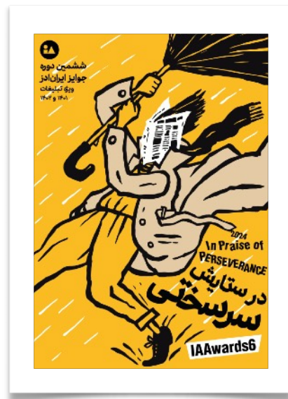
جوایز ششم: آذر ۱۴۰۳ رویکرد: معرفی بهترین آگهی های ۱۴۰۱ و ۱۴۰۲