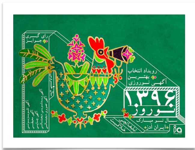
رویداد اول: ۲۴ فروردین ۱۳۹۶ رویکرد: معرفی بهترین های نوروز ۹۶