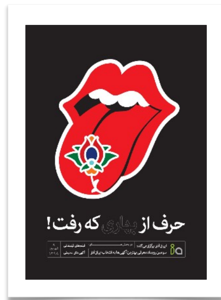
رویداد سوم: ۲۹ شهریور ۱۳۹۸ رویکرد: معرفی بهترین آگهی های بهار ۹۸