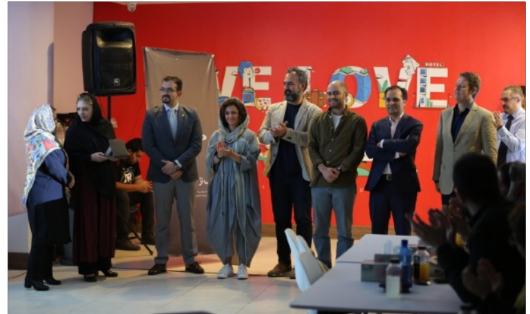
سومین رویداد معرفی بهترین آگهی ها به انتخاب ایران ادز، ۱۳۹۸