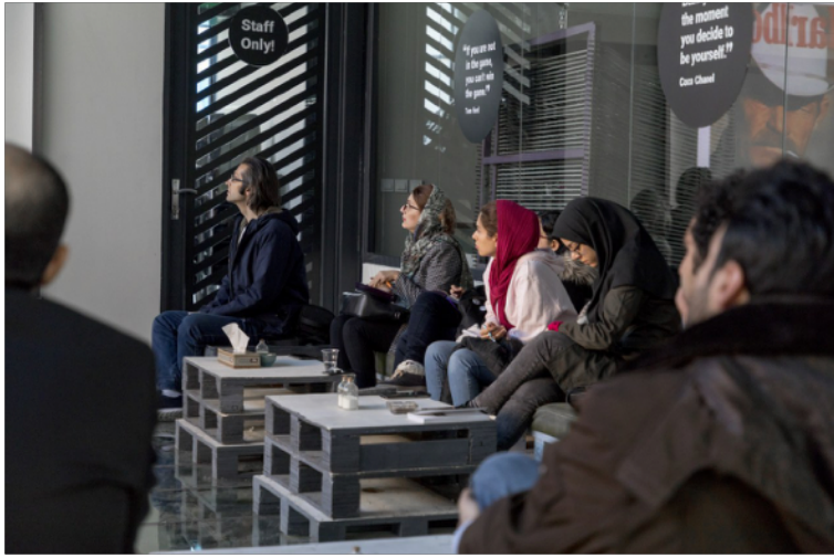
ورکشاپ تاریخ تبلیغات، ۱۳۹۷