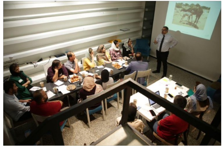
ورکشاپ تقلب رسانی از آن سوی میز، ۱۳۹۸