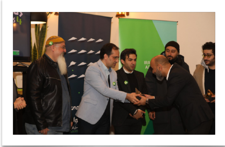
چهارمین جوایز ایران ادز