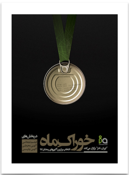
رویداد دوم: ۲۴ تیرماه ۱۳۹۶ رویکرد: معرفی بهترین های رمضان ۹۶