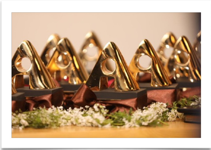
چهارمین جوایز ایران ادز