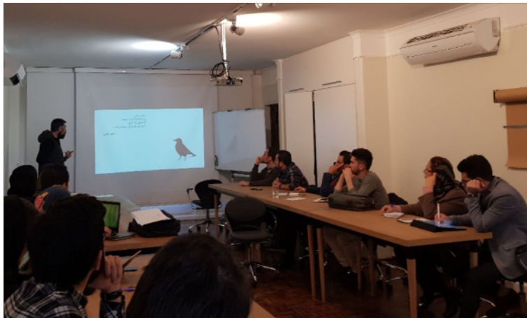
ورکشاپ بریف، ۱۳۹۷