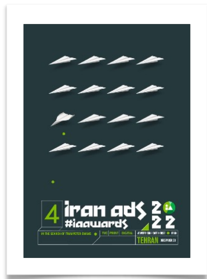
جوایز چهارم: ۳۰ دی ۱۴۰۰ رویکرد: معرفی بهترین آگهی های ۹۹