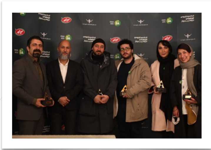
چهارمین جوایز ایران ادز